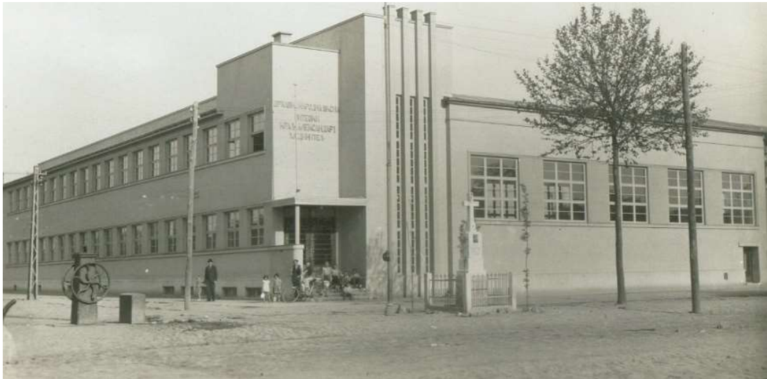
Школа „Витешки краљ Александар I Ујединитељ“ подигнута 1938.године