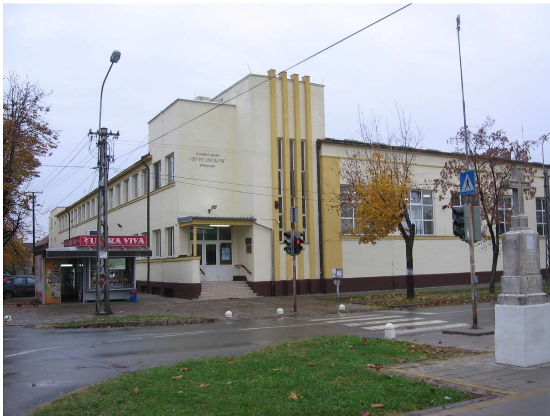
Школа „Ђура Јакшић“ - данас

Дефинисане су и редовно се проверавају и увежбавају поступци, обавезе и одговорности ученика, наставника и запослених, како у редовним условима тако и у условима елементарних непогода (пожар, временске неприлике и слично). Периодично се спроводи вежба евакуације ученика, наставника и запослених услед пожара. Подстиче се и промовише негативан став према насиљу, анализирају се случајеви насилног понашања, а предвиђене су одговарајуће мере за кршење прописаних и усвојених норми понашања. Школа у области подршке остварује сталну сарадњу са чиниоцима друштвене средине и релевантним институцијама (Медицинске установе, Центар за социјални рад, МУП). У школи добро функционише тим за заштиту деце од насиља, злостављања и занемаривања који доприноси смањењу насиља и решавања конфликта мирним путем. Са ученицима, са којима је то неопходно спроводи се појачан васпитни рад, тако да се ученици у школе осећају безбедно (о чему сведоче и резултати анкете).