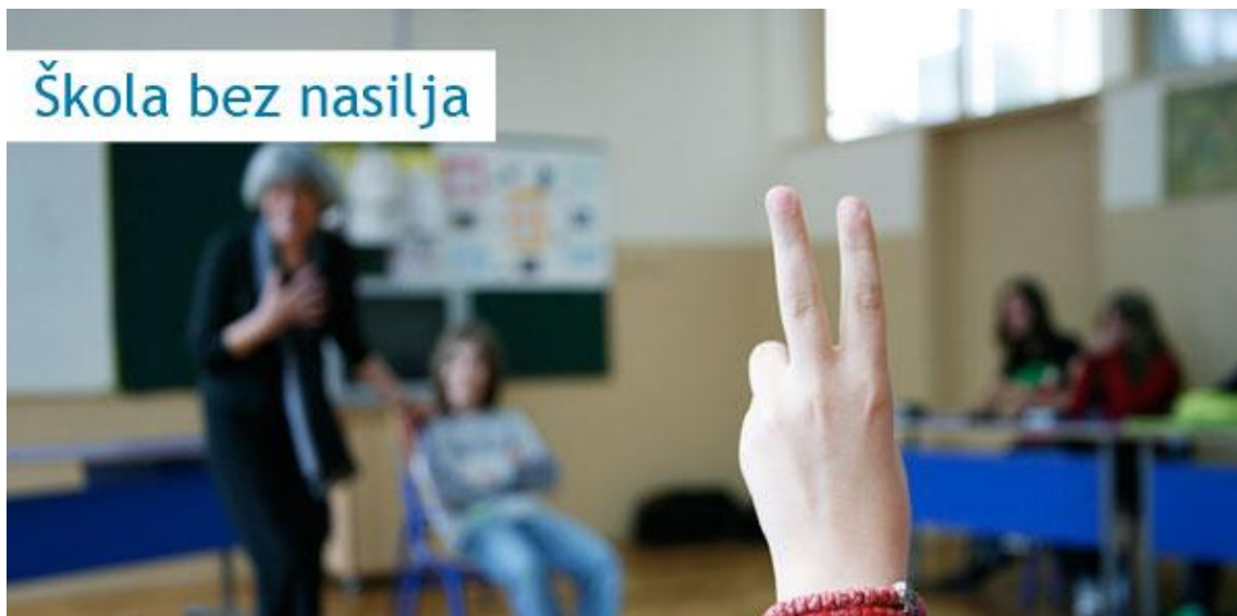
Програм „Школа без насиља – ка сигурном и подстицајном окружењу за децу“

Реализација програма „Школа без насиља“ започета је школске 2005/06. године. Програм спроводи УНИЦЕФ у сарадњи са Министарством просвете, Министарством здравља, Министарством рада и социјалне политике, Саветом за права детета, Заводом за унапређивање образовања и васпитања, а од школске 2008/09. године и са Министарством унутрашњих послова и Министарством омладине и спорта.