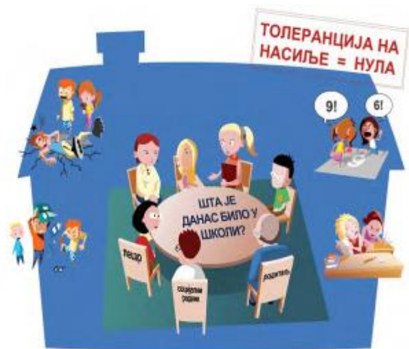
Спољашња заштитна мрежа