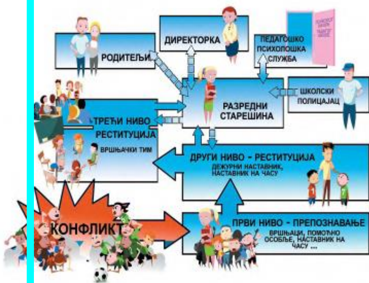
Унутрашња заштитна мрежа

Поразговарати о унутрашњој и спољашњој заштитној мрежи. Приказати родитељима актере у мрежи.