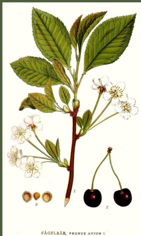
FÄGELBÄR, PRUNUS AVIUM L.

Трешња (раније чрешња од лат. se rasia ) листопадна је дрвенаст биљка из потфамилије Prunoideae, чији се истоимени плодови користе у људској исхрани као воће. Најчешће је висока око 20 m. У Европи се све ређе може наћи у природи па је ова врста дрвећа данас угрожена. Трешња је припитомљена и има велики значај у воћарској производњи.